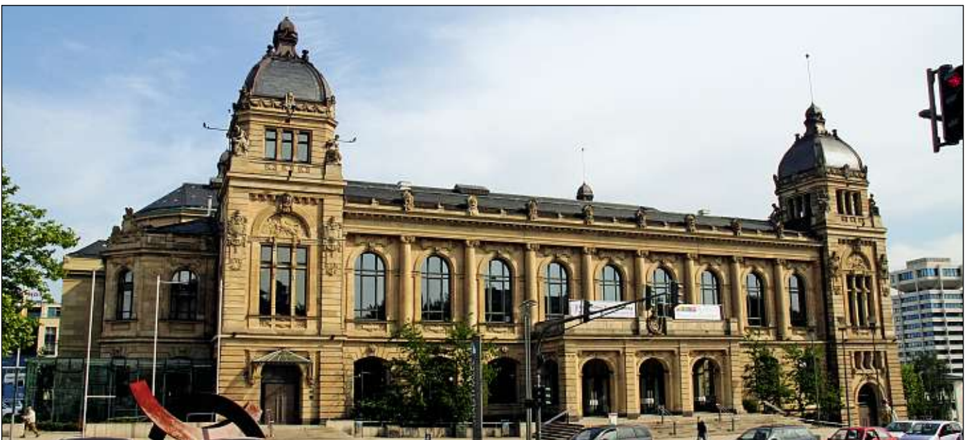
Historische Stadthalle am Johannisberg in Wuppertal.